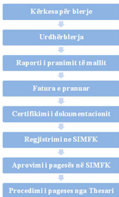
Figura 3. Procedurat e përgjithshme për procedimin e pagesave

Siç mund të vërehet nga figura nr.3, duhet ndjekur disa procedura për pranimin e mallit dhe procedimin e pagesës, si në vijim: