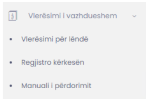
Figura 1: Pamja kryesore

Pasi të kyçeni ne sistem, klikoni në menyën Vlerësimet e vazhdueshme .